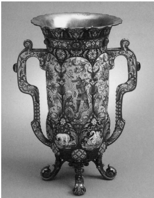
6. Ваза, Москва 1900-1908, Сверуски музеј декоративно-примењене и народне уметности Москва Vase, Moscow, 1900-1908, All-Russia Museum of Decorative-Applied and Folk Art, Moscow