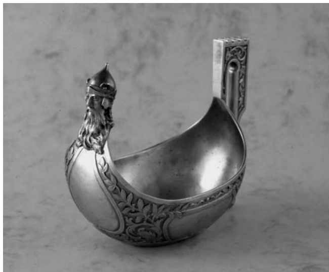
1. Ковш, украсна посуда, 1908-1916, Етнографски музеј, инв. бр. 41662, Београд “Kovš”, decorative vessel, 1908-1916, Ethnographic Museum Inv. No. 41662, Belgrade

Његова занатска школа налазила се у Москви; била је смештена у две одвојене зграде повезане пасарелом, а у њиховом саставу биле су спаваће собе за ученике,