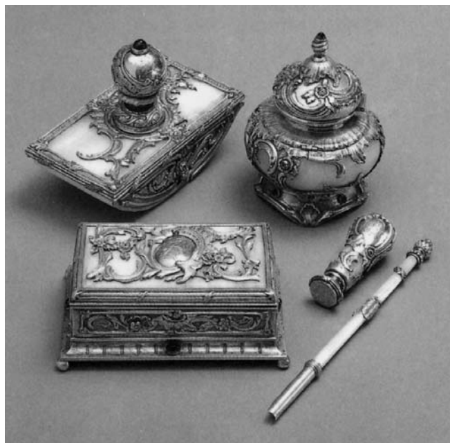
5. Прибор за писање, Петербург 1896, Сверуски музеј декоративно-примењене и народне уметности Москва Writing set, St. Petersburg, 1896, All-Russia Museum of Decorative-Applied and Folk Art, Moscow