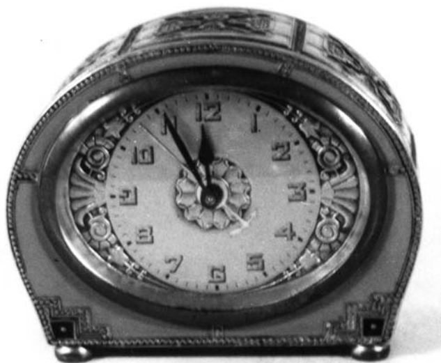
4. Будилник, касна сецесија, средња Европа, прва четвртина XX века, Музеј Војводине, инв. бр. 223, Нови Сад Alarm clock, late Art Nouveau, Central Europe, first quarter of 20 th century, Museum of Vojvodina, Inv. No. 223, Novi Sad