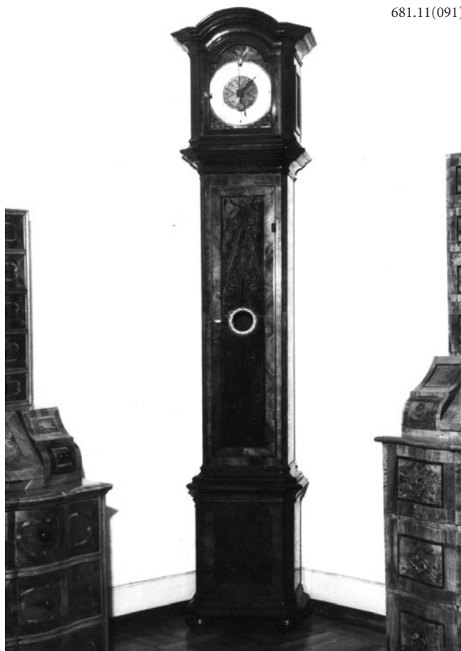
1. Стајаћи подни сат, барок, Енглеска (?), средина XVIII века, Музеј Војводине, инв. бр. 168, Нови Сад Long-case clock, Baroque, England (?), mid-18 th century, Museum of Vojvodina, Inv. No. 168, Novi Sad

Иако су се предмети најчешће откупљивали, понекад се до експоната долазило путем поклона или оставштине. Године 1991. Музеју је поклоњено 250 сатова из заоставштине Антона Черноша, колекционара из Врдника.