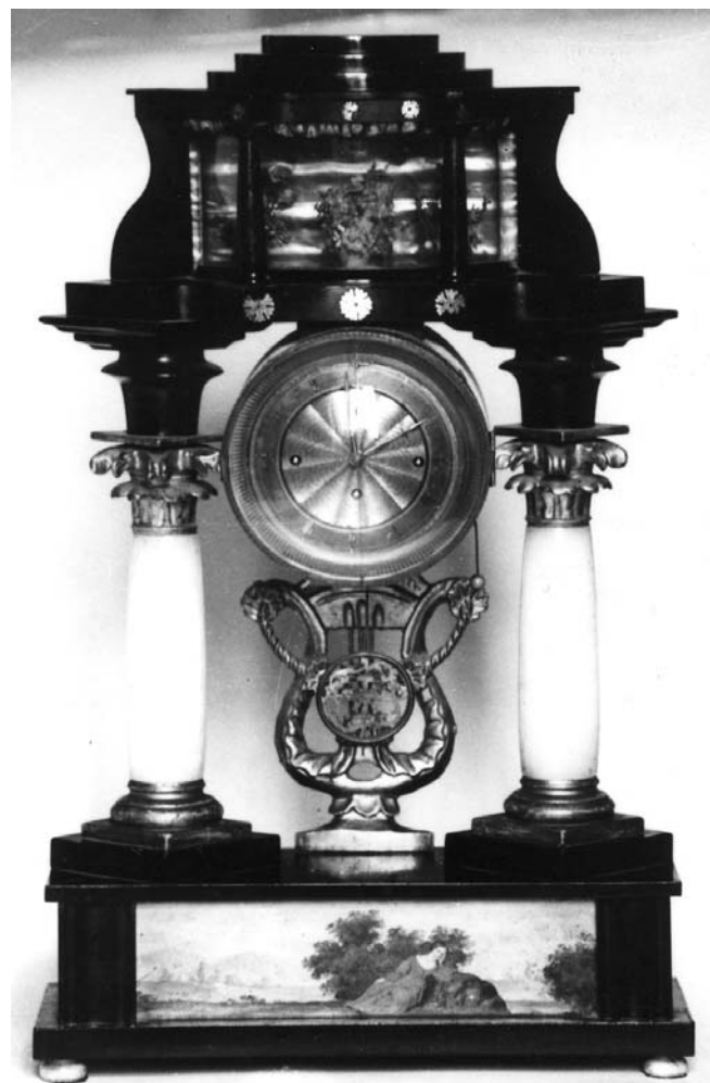
3. Стајаћи сат, бидермајер, Аустрија, око 1840, Музеј Војводине, инв. бр. 1, Нови Сад Long-case clock, Biedermeier, Austria, around 1840, Museum of Vojvodina, Inv. No. 1, Novi Sad

Међу најрепрезентативније примерке Збирке спадају сатови табернакли из времена рококоа и класицизма са краја XVIII века. Механизам сата је смештен у релативно скроман застакљени ормарић чији се горњи део степенасто уздиже. На врху кућишта је најчешће месингана дршка, те украси у виду апликација или стилизованих бакљи. По изгледу ове сатове од осталих издваја, поред других карактеристика, и специфичан полукружно засведен бројчаник са показатељем за календарске дане месечеве мене и уређаји за звоњење (сл. 2). Некадашња богата симболика барока на кућиштима се задржала само у виду гирланда и аморета на дршкама и скромних флоралних апликација у угловима. Сатови носе сигнату-