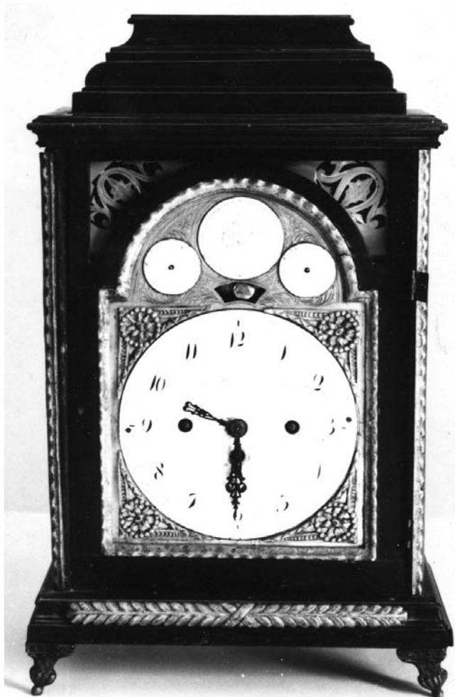
2. Сат-табернакл, класицизам, Беч, око 1780, Музеј Војводине, инв. бр. 193, Нови Сад Clock-tabernacle, Classicism, Vienna, around 1780, Museum of Vojvodina, Inv. No. 193, Novi Sad