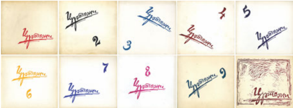
1. Насловне стране едиције Цртежи , бр. 1–10. 1. Cover pages from the edition Crteži [Drawings], Nos. 1–10

Уређивачка политика која се заснивала на ставу да часопису није потребна никаква програмска декларација и да нема постављеног критеријума при