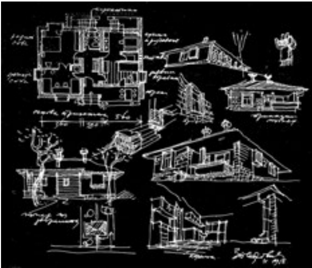
6. Зоран Петровић, Архитектонски пројект за традиционалну сеоску кућу, Цртежи , бр. 2, 1957 6. Zoran Petrović, Architectural project for a traditional village house, Crteži , no. 2, 1957