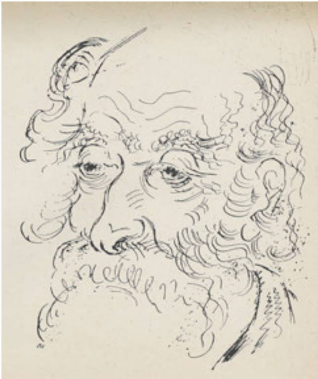
2. Александар Дероко, Портрет старца, Цртежи , бр. 4, 1959 2. Aleksandar Deroko, Portrait of an old man, Crteži , no. 4, 1959

одабир графичких прилога које је сваки учесник, односно аутор самостално приложио на основу корисних разговора и савета који су разјаснили поједине недоумице и подстакли саговорнике. Цртачки клуб се сваке године увећавао новим члановима из редова наставног особља, потом и студената, а карактерисала га је првенствено стваралачка слобода, па отуда и разноликост тема, техника и начина графичког изражавања. Публиковани цртежи показују да није било разлике између аматерских и професионалних сликарских радова.