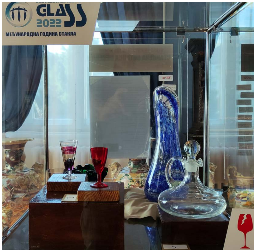
4. Алибунарско стакло у оквиру пројекта Стаклена витрина месеца Народног музеја Зрењанин, јул 2022.

након брисања компаније из привредног регистра организована је изложба под називом Наше стакло поводом манифестације Ноћ музеја у Народном музеју Зрењанин, када су по први пут у музеолошком смислу представљени предмети произведени и у Фабрици стакла Украс у Алибунару (Vorgić and Geiselberger 2016). Систематско проучавање настављено је и у наредном периоду, када алибунарски предмети постају део културног покретног музејског наслеђа Србије. Додатни импулс и замах у истраживању стигао је са обележавањем Међународне године стакла , која је са успехом организована у више музејских институција током 2022. године, где се алибунарско стакло нашло на више изложби и пројеката паралелно са водећим српским и југословенским произвођачима стакла (сл. 4).