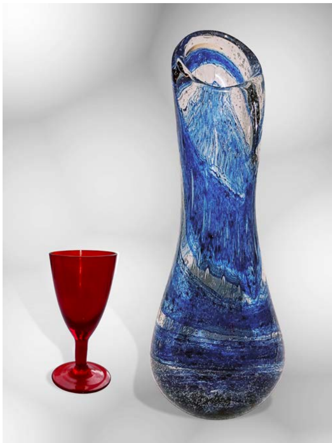
1. Чаша столовата за кратка пића (1970–1980) и ваза Тиква (1980–1995) 1. Table glass for short drinks (1970–1980) and Pumpkin vase (1980–1995)

налазиле специфичне технике, као што је кристални лед. Незнатно касније почели су да се примењују и трансфер декор пресликачи, који су наручивани од произвођача из Словеније. У фабрици је усвојен и примењиван широк дијапазон боја стакла: зелена (светла и турмалин), ћилибар, розалин, плава (светла, тиркиз и кобалт), црвена (рубин), љубичаста (аметист) и посебно популарна дим-браон (Алмажан 2016; Крсмановић 2022). Сервисе од ручно дуваног дим-стакла Фабрика Украс представила је и изложила на Јесењем загребачком велесајму 1984. године (Marcen 1984). Стаклара је производила и вишебојне предмете, али и оне од непрозирног стакла, попут опала (млечно стакло) и црне боје (Крсмановић 2022).