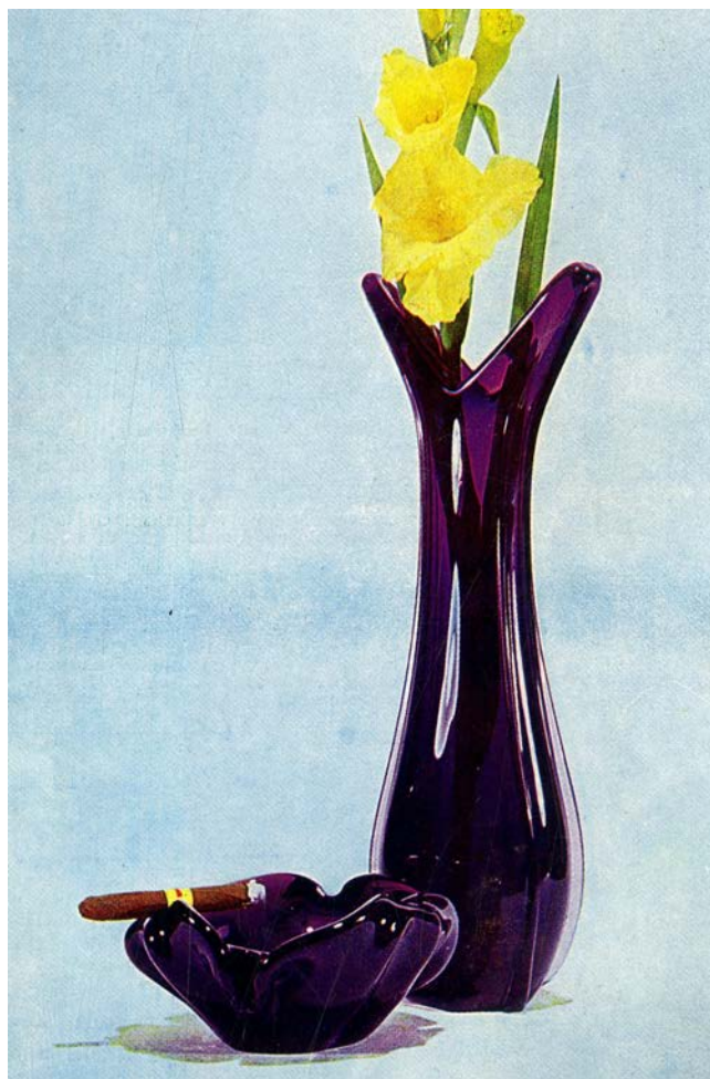
2. Ваза Еlegant с пепељаром, проспект Фабрика украсног стакла – Алибунар 1970–1979. 2. Elegant vase with ashtray , Factory of decorative glass – Alibunar 1970-1979 brochure

производима различите намене, форме и начина декорације, постоји неколико карактеристика које се могу издвојити као својеврсни печат који Украс издваја од осталих произвођача. Посреди су, пре свега, истакнути трбух који се често јавља на грлу флаша и ногама чаша, али и позлаћена линија на стопи столоватих чаша која, на основу досадашњих сазнања, није коришћена као декорација у другим стакларама. Било је примера када су традиционалне форме са успехом комбиноване са модерним централноевропским стремљењима, као што је артикал из осамдесетих година на који су утицали вински декантери широког и ниског тела (сл. 4). Посебан програм фабрике чинили су предмети настали не само дувањем већ и ручним обликовањем растопљене стаклене масе, која је добијала слободније форме од вештих алибунарских стаклара. Ту, пре свега, мислимо на предмете као што су вазе и пепељаре (сл. 2). Неке од ваза, као што је случај с примером колоквијалног назива Тиква који има заробљене мехуриће ваздуха у структури, развијене су уз помоћ