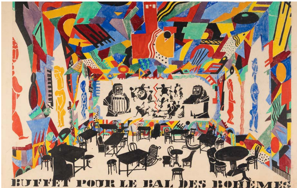
1. Нацрт за ентеријер сале за одржавање уметничког бала Хиљаду и друга ноћ , 1923, МПУ 18354 1. Design for the interior of the hall for holding the One Thousand and Two Nights art ball , 1923, MAA 18354