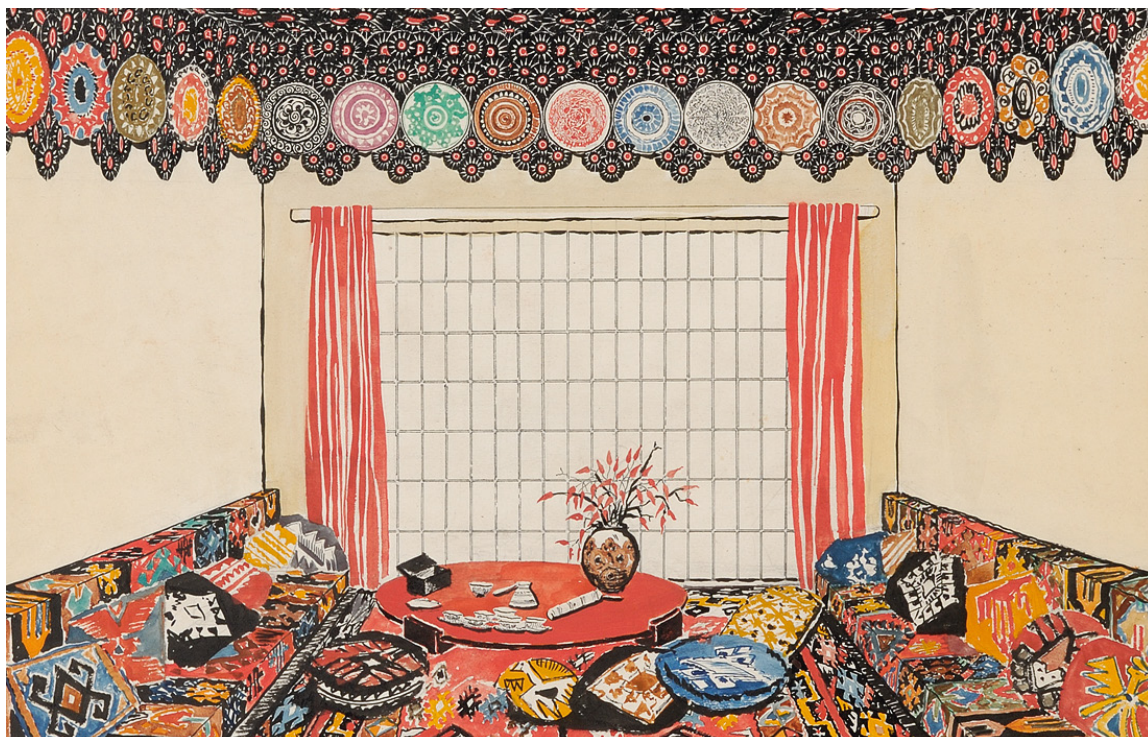
2. Нацрт за ентеријер просторије у кући Јована Цвијића, 1925, МПУ 12741 2. Design for the interior of a room in the house of Jovan Cvijić, 1925, MAA 12741