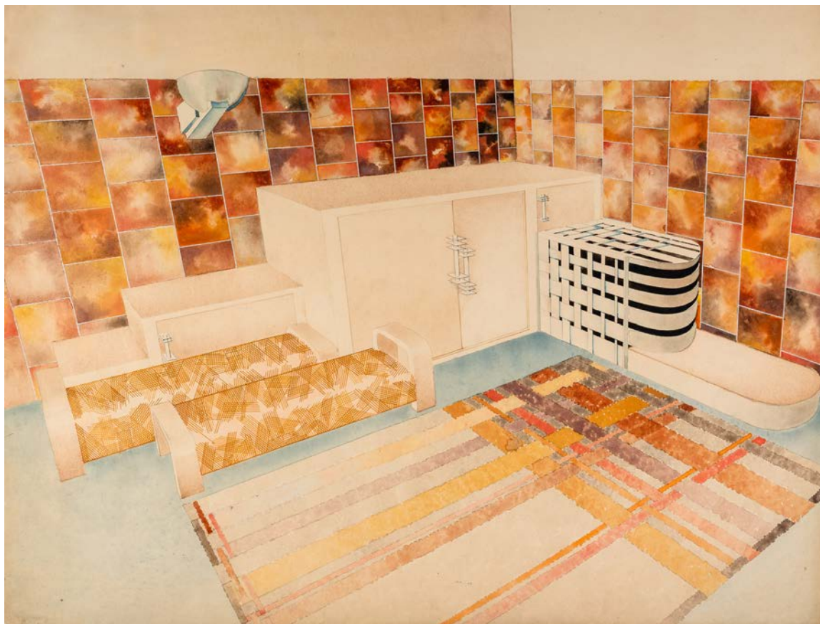
4. Нацрт за ентеријер дневне собе виле у Сен Клуу, 1934, МПУ 12735