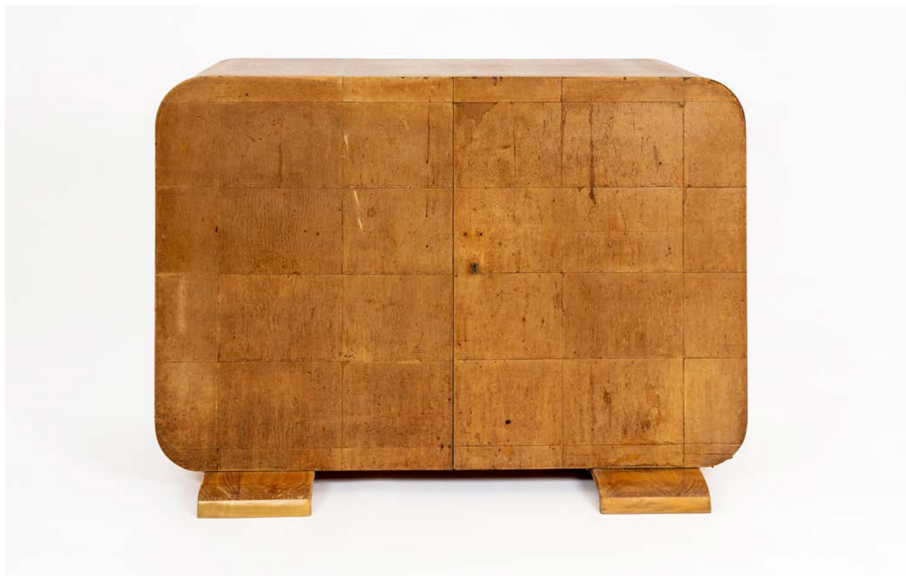
7. Комода, око 1937, МПУ 26237 7. Commode, around 1937, МАА 26237