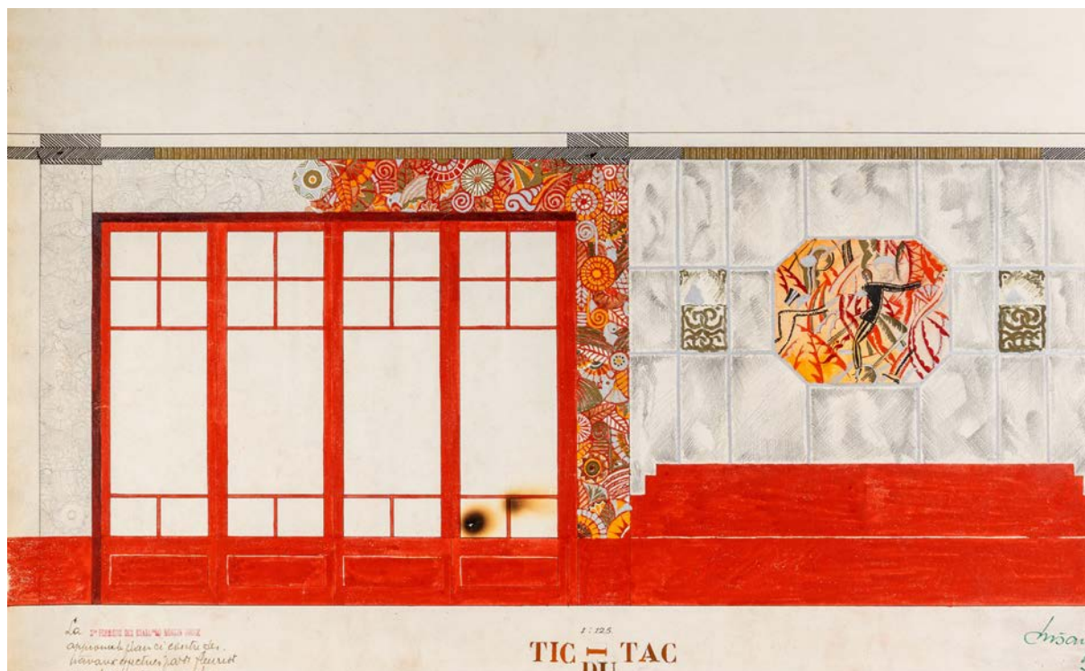
3. Нацрт за осликавање сале кабареа Мулен руж , 1925, МПУ 12742