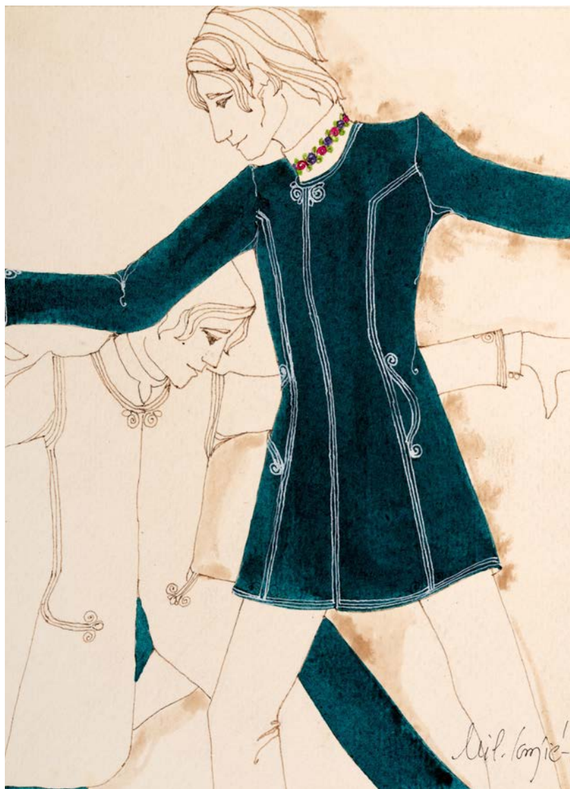
1. Модна илустрација, 1967, МПУ 25287/1 1. Fashion illustration, 1967, МАА 25287/1

Милорад Мики Игњић (4. 9. 1942, Обреновац – 20. 9. 2017, Београд) потекао је из породице у којој је од самог почетка био у додиру са финим занатима. Отац Милован био је „златар, часовничар и оптичар, који је више година радио у Бечу. И деда је био часовничар. Породица златних руку, јер је реч о занатима који траже вештину, стрпљивост и креирање, сигурно је имала утицаја на формирање његових склоности” (Лукић Чавић 1989: 27-29). Педантност и прецизност, према сведочанству савременика, красиле су и Микија Игњића, а свакако су неопходне особине за професије којима ће се посветити, прво студирајући архитектуру, а затим упловивши у воде модног дизајна.