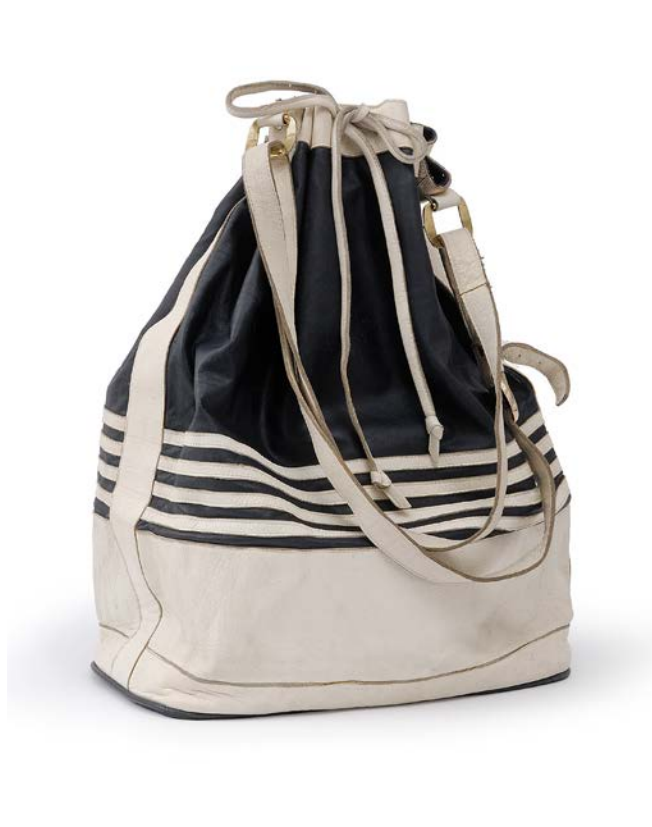
4. Путна торба из колекције Рамона Александра Јоксимовића, 1974, МПУ 25273

Поштовање према старим занатима (као што је у случају Мозаика опанчарски) показаће и на својој самосталној изложби ташни 1976. године применивши сарачки метод (шивење кожом). Од 1. до 8. марта у Удружењу манекена изложио је 40 ручно рађених ташни од коже реализованих овом техником, као и модне илустрације (сл. 5). Модни дизајнер који „своје ‘конструкције’ ташни дугује ранијим студијама архитектуре” приказао је свечане, модерне ташне и ташне у духу фолклора: црне, смеђе, зелене и у природној боји коже (М. Бл.: 1976). Сматрао је да уметници који се баве модом ретко излажу, наглашавајући да је због тога желео „да на ташни, модном детаљу којим се најчешће бавим, покажем и креативност и занатски начин обраде...” 14 (М. С. 1976). У новинским прилозима посвећеним тој изложби