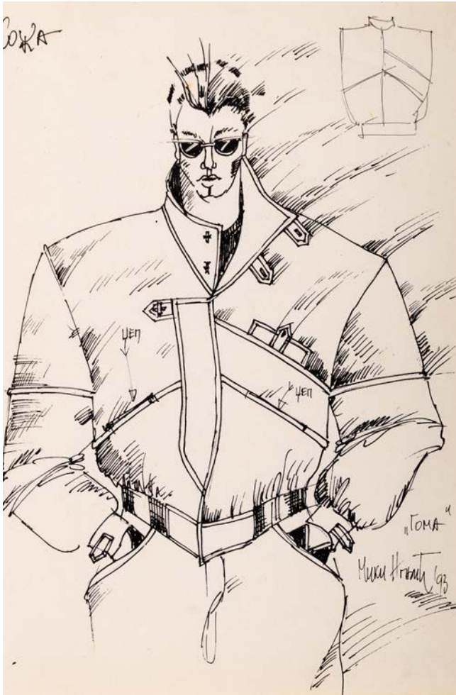
7. Скица за мушку јакну за Гому, 1993, МПУ 25299/5 7. Sketch for men's jacket for Goma, 1993, MAA 25299/5