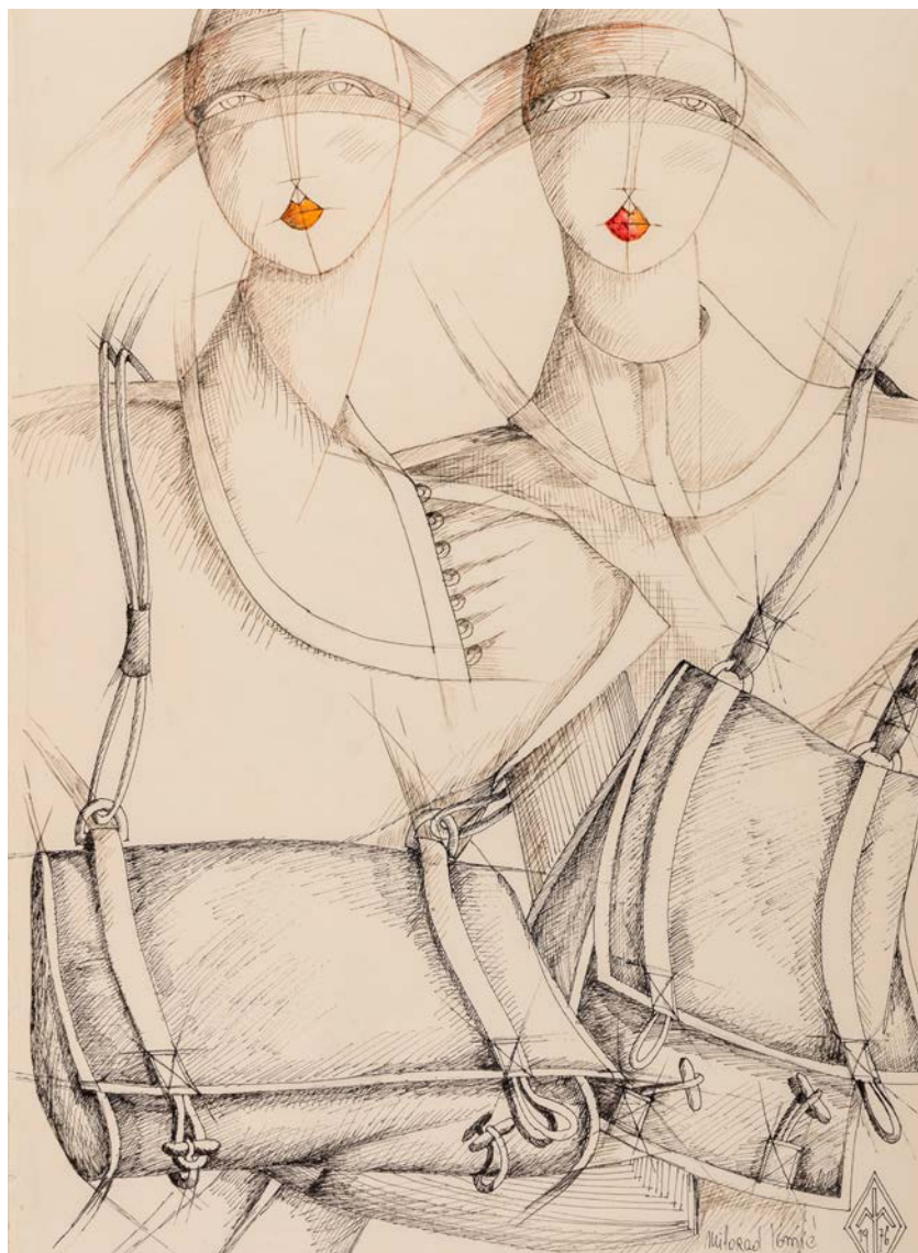
2. Модна илустрација, 1976, МПУ 25282/3 2. Fashion illustration, 1976, МАА 25282/3

Међународног сајма кожне галантерије у Милану, на коме су се малом броју трговаца и модних креатора представљали новитети из светских модних центара, донео револуционарну новост – појаву мушких ташница. Тај модни додатак настао је као реакција на моду тесних мушких сакоа у чије џепове ништа није могло да стане. Са друге стране, женске ташне достигле су величину путне торбе, а појасеви нису представљали само функционални већ и декоративни елемент. Још једна важна вест са тог догађаја, а која говори о томе колико је модни диктат био строг, јесу боје које ће од тог тренутка искључиво бити заступљене – све нијансе браон боје (од природне боје коже до најтамнијих нијанси), док до тада актуелне боје љубичаста и црвена потпуно нестају са сцене. Најбољи доказ за то, каже Игњић, јесте да су у Милану „на распродаји биле све љубичасте ташне и ципеле!“ (Аноним 1971).