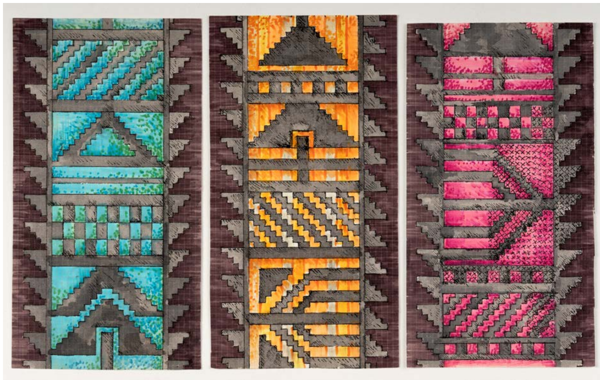
6. Орнаменти за плетене моделе, око 1991, МПУ 25314 6. Ornaments for the knitted models, about 1991, МАА 25314