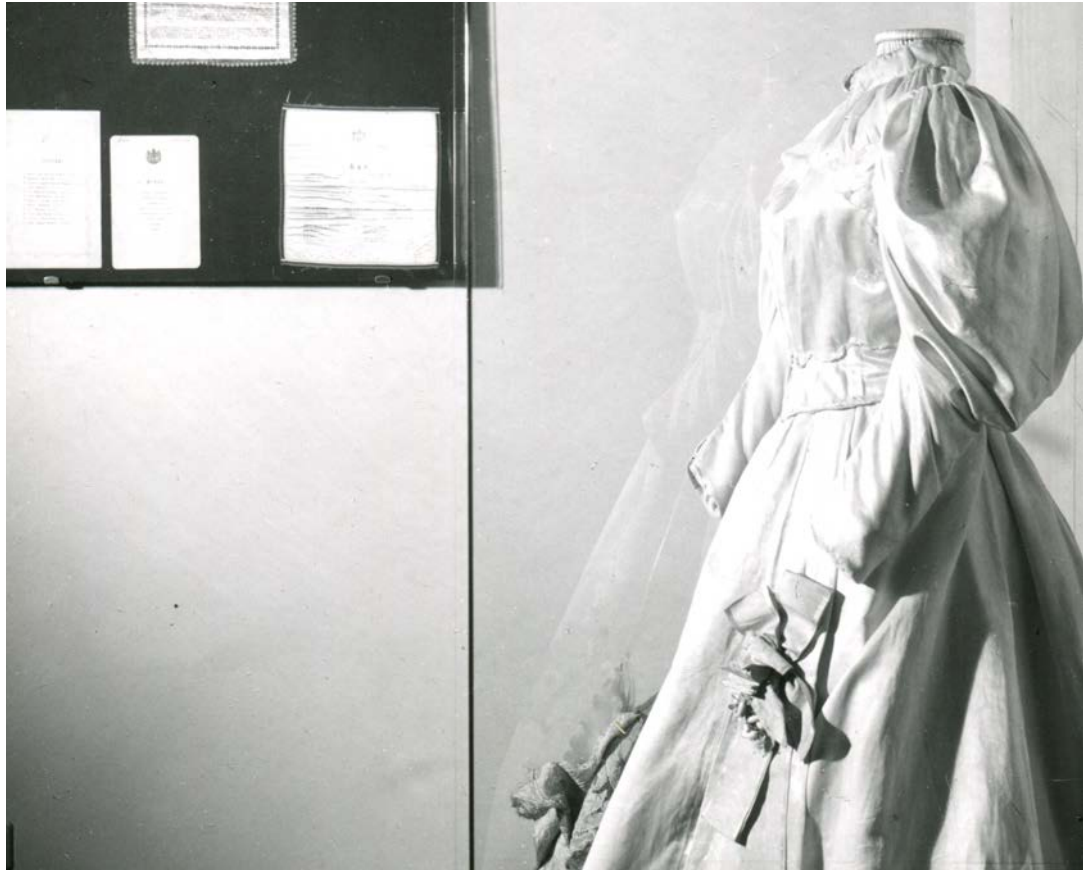
3. Хаљина МПУ, инв. бр. 5207 на обновљеној сталној поставци, Музеј примењене уметности у Београду, 1958. 3. MAA dress, acc. no. 5207 on the renewed permanent exhibition, Museum of Applied Art in Belgrade, 1958

(сл. 2). Информација о визуелним и техничким карактеристикама хаљине, као и подаци о њеној историји, пренета је и на поставци и у илустрованом пратећем каталогу изложбе, који садржи студијски текст и каталожке јединице (Маскарели 2019: 59–60, 118) 1 .