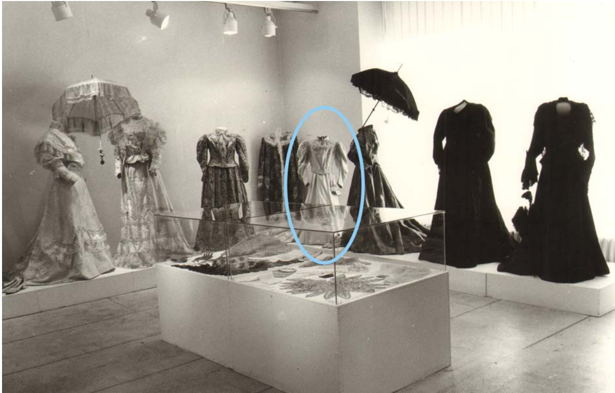
4. Хаљина МПУ, инв. бр. 5207 на изложби Градска ношња у Србији током XIX и почетком XX века , Музеј примењене уметности у Београду, 1980. 4. MAA dress, acc. no. 5207 at the exhibition Urban Dress in Serbia in the 19 th and Early 20 th Centuries , Museum of Applied Art in Belgrade, 1980

Хаљина МПУ, инв. бр. 5207 излагана је и на изложбама Женска мода од средине XIX века до тридесетих година XX века (1966) и Градска ношња у Србији током XIX и почетком XX века (1980). На обе изложбе била је постављена заједно са другим хаљинама из истог периода (сл. 4), док је у каталогу изложбе Градска ношња издвојена као пример модне линије актуелне у последњој деценији XIX века (Стојановић 1980: [31], кат. бр. 279)