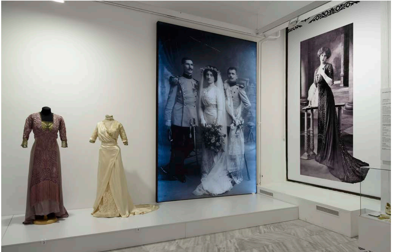
5. Хаљине МПУ, инв. бр. 22702 и 22891 на изложби Мода у модерној Србији , Музеј примењене уметности, Београд, 2019. 5. MAA dresses, acc. no. 22702 and 22891 at the exhibition Fashion in Modern Serbia , Museum of Applied Art, Belgrade, 2019

окурењу електронских и дигиталних слика, ови одевни предмети, претворени од употребних артефаката у уметничка дела, били су живи актери некадашње стварности који нам посредно много саопштавају и о садашњости (Васић 2020: 63).