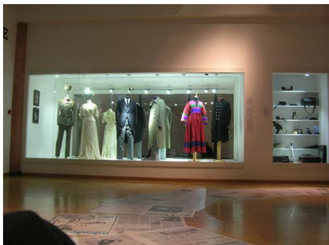
6. Хаљина МПУ, инв. бр. 22891 на изложби Чедомира Васића И пре и после и сада , Историјски музеј Србије, 2016. 6. MAA dress, acc. no. 22891 at the exhibition of Čedomir Vasić Before, After and Now , Historical Museum of Serbia, 2016