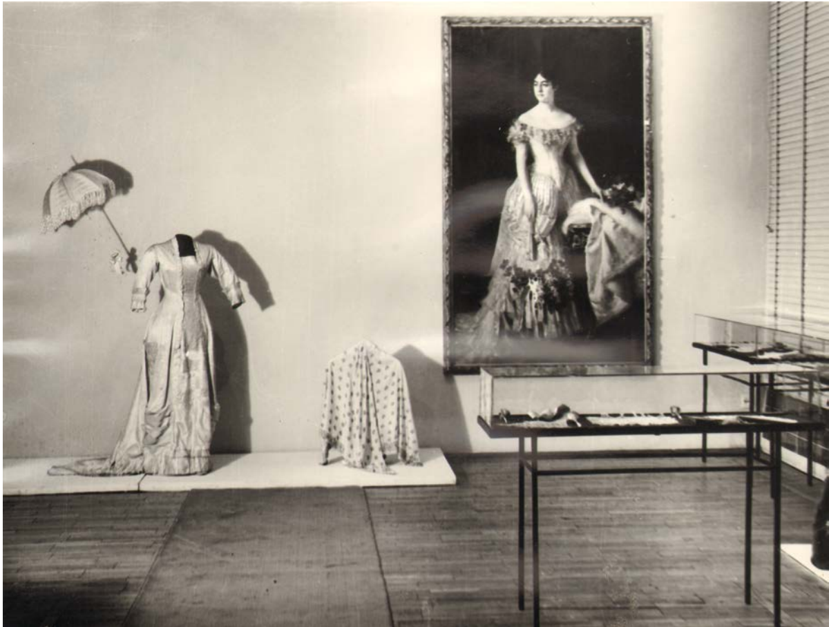
1. Хаљина МПУ, инв. бр. 5593 на изложби Женска мода од средине XIX века до тридесетих година XX века , Музеј примењене уметности у Београду, 1966.