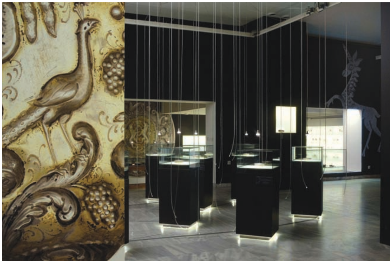
1. Детаљ поставке Сребрне чаше позног средњег века у Србији 1. Detail of the display: Silver Bowls from the Late Middle Ages in Serbia

Аутори приказа су: Душан Миловановић, историчар уметности и музејски саветник МПУ и др Зоран Ракић, историчар уметности и професор на Филозофском факултету у Београду.