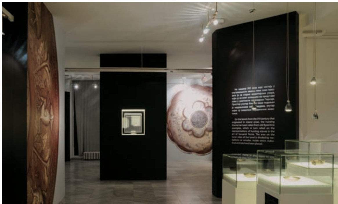
5. Детал поставке Сребрне чаше позног средњег века у Србији 5. Detail of the display: Silver Bowls from the Late Middle Ages in Serbia