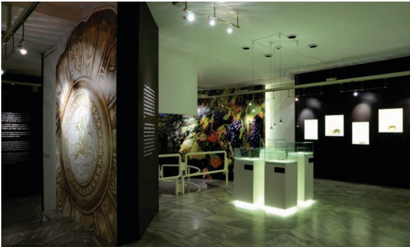
2. Детаљ поставке Сребрне чаше позног средњег века у Србији 2. Detail of the display: Silver Bowls from the Late Middle Ages in Serbia

Од оснивања, Музеј примењене уметности држи се добре праксе да најзначајније резултате дугогодишњег рада сопствених стручњака представи и публикује на такозваној студијској изложби која се, у свечаној атмосфери увек одржава 6. новембра, на Дан музеја. На овај начин постиже се више ефеката: задовољава се медијска знатижеља која је, већ традиционално, усмерена на овај датум и догађај; стручна и научна јавност а и публика се, путем изложбе и каталога подробно упознају с новим резултатом; даје се посебно достојанство самом резултату а и аутору изложбе односно пројекта. У протеклим деценијама, Музеј је пред очи наше јавности изнео резултате којима би могле да се подиче и знатно старије и у многим погледима богатије институције. Изложбе су