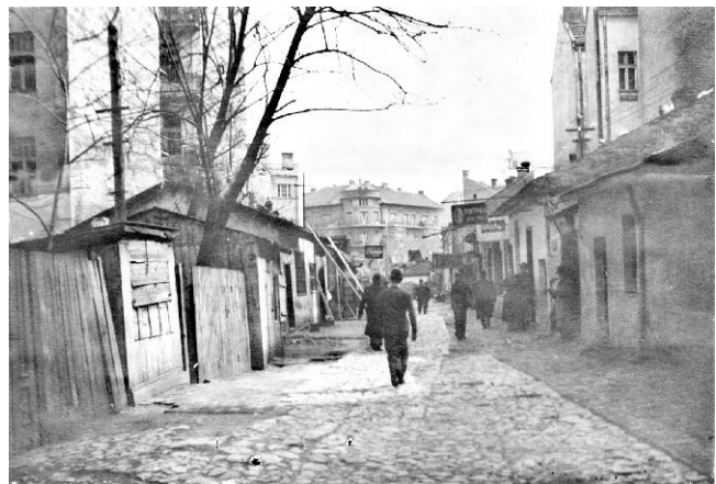
2. Кузмановићев пролаз између Теразија и Дечанске улице, око 1937. 2. Kuzmanovic Alley between the Terazije and Dečanska Street, circa 1937.