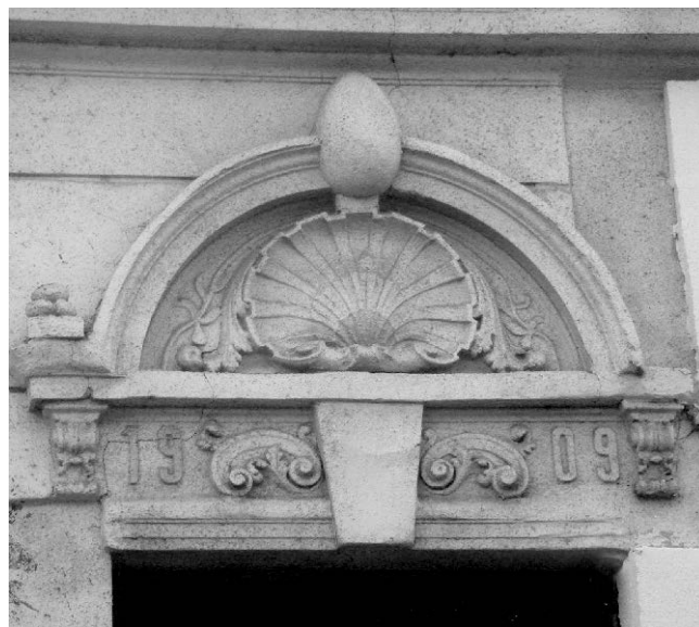
6. Деталј фасаде зграде у улици Сибињанин Јанка 7. 6. Detail of the building façade at 7 SibinjaninJanka Street.

Материјал и квалитет зграда зависио је од периода настанка и материјалних могућности власника – рентијера. Тако су куће, подигнуте крајем XIX века, махом биле грађене од опеке старог формата, са зидовима и споља и изнутра облепљеним блатом, подом од опеке и покривене ћерамидом, а касније бибер црепом. Авлијске зграде су најчешће биле зидане од опеке у кречном малтеру, дебљине пуне опеке, са дрвеним надпрозорницима и надвратницима, са врло једноставном дрвеном кровном конструкцијом и покривене црепом. Надпрозорници и надвратници су били дрвени. Најбеднији станови, чатрље и учерице, били су направљени од дасака често облепљених блатом, а у најбољем случају од четврт или половине опеке. Обликовне карактеристике зграда са рентијерским становима за сиромашне, и то превасходно авлијске зграде, одликовала је крајње сведена форма као и подражавање стилских елемената са кућа имућнијих грађана (сл. 6). Фасада ка улици је уобичајено била подељена у три хоризонтална појаса – истакнуту соклу, главни део фасаде са прозорима и зону надзетка и крова. Коришћени су тимпанони, балустери, кровни венци и други орнаментални и декоративни материјал. Њихова примена је требало да истакне „финоћу“ куће и повећа укупну вредносну слику о власнику.