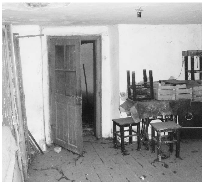
5. Ентеријер стана у улици Бистричкој 15. 5. Interior of an apartment at 15 Bistrička Street.

бодностојећи објекти од једне просторије, минималне површине од 5-10 м 2 , мале висине од 1,5 до 2 м, направљени од лошег материјала, или станови-собе у мањим лошим кућама, које су имале засебан улаз. Ту спадају и собе у авлијским зградама или вишепородичним зградама, које су такође имале засебан улаз. Њихова површина је била као и код слободностојећих објеката од једне просторије, а предност је била у нешто бољем квалитету изградње. Дводелни станови су се састојали од кујне и собе и, као што смо видели, били су преовлађујући тип стана у коме је становала сиротиња. Површина стана се кретала од 20 до 30 м 2 , а висина у крајњем и до 2,5 м. У неким, мада ређим случајевима, срећемо и станове веће површине и до 40 м 2 . Треба напоменути да је постојао и одређени број вишеделних станова који су поред кујне и собе имали и предсобље, клозет и малу оставу, али их овде не издвајамо као карактеристичан облик, јер се радило о релативно малом броју у укупном фонду станова које је изнајмљивало сиромашно становништво.