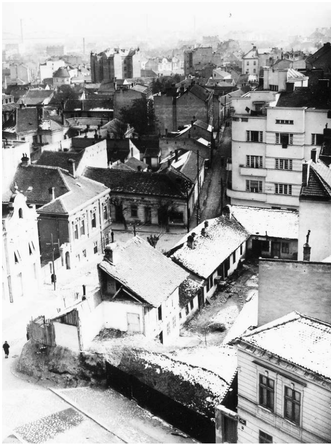
1. Енклава рентијерских станова на углу Симине и Скадарске улице, 1932. 1. Rental apartments enclave on the corner of Simina and Skadarska Street, 1932.

лунској, Светозара Милетића и на Гундулићевом венцу, у деловима изнад Техничког факултета и око Смедеревског ћерма, у улици Краља Александра, Краљице Марије и Расинској, па поред Железничке станице, у Босанској и Сарајевској улици, на Хајдук Вељковом венцу, и на бројним другим локацијама.