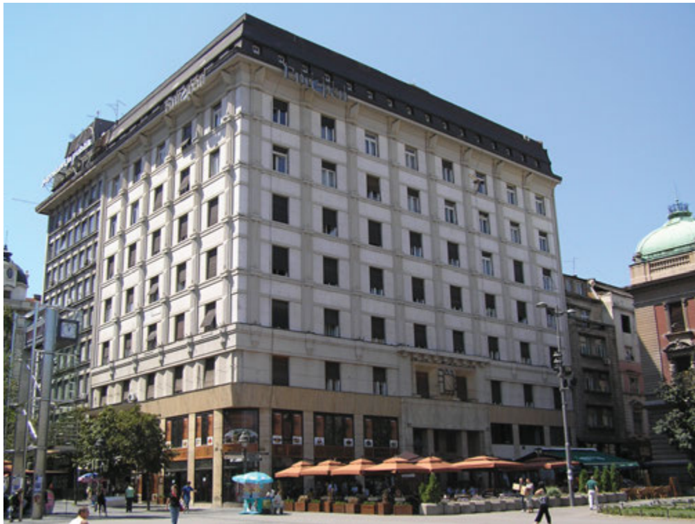
1. Палата „Реуниона“, данашњи изглед 1. "Reuniona" Palace, present view

вите киоске, романтичне варијетее, пријатна шеталишта, егзотичне ресторане, кафане и посластичарнице, нанизане дуж непрегледних авенија и тргова, скретала се пажња са горућих друштвених проблема; ову појаву је правовремено критиковао Хозе Ортега и Гасет (José Ortega y Gasset; Ортега и Гасет 1988). На штету образованијих слојева, подилазило се укусу малограђанске и непросвећене већине, како би се њоме лакше манипулисало. Заводљивим лепршавим здањима и китњастим урбаним мобилијаром одашиљала се идеализована слика о цивилизацијској супериорности капиталистичке