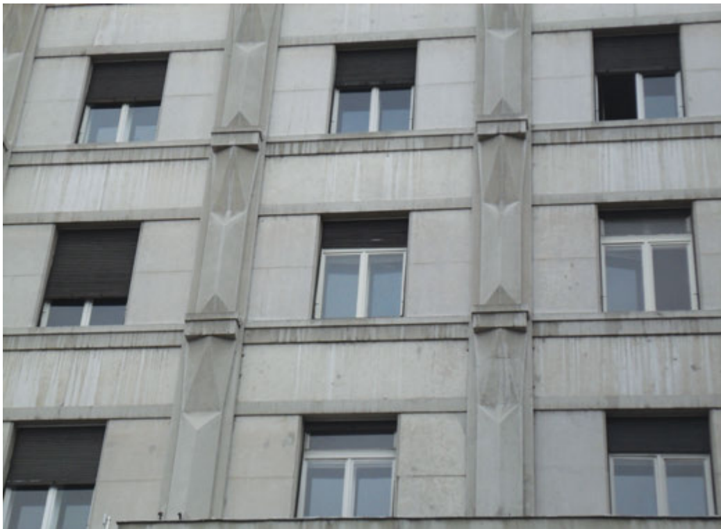
7. Детаљи средњег појаса pročеља „Реунионе“ у Чика Љубиној улици 7. Details of the middle zone of the front view of “Reuniona” in Čika-Ljubina Street

мансарде 3,52 и крова 4,10 метра. Укупна висина грађевине је 38,60 метара. Она се налази на парцели од 938 квадратних метара, док њена укупна кубатура износи 38.300 кубних метара. Под зградом је било 726, док је двориште заузеле 212 квадратних метара, што је у складу са тадашњим београдским просеком, према коме је грађевина заузимала три четвртине парцеле. Дубина бетонских темеља палате је до десет метара. До висине првог спрата међуспратна конструкција је армирано-бетонска, да би навише био комбинован бетон са утљом. У делу здања окренутом споменику зграда има две подрумске етаже, док се у јединој етажи према Обили-