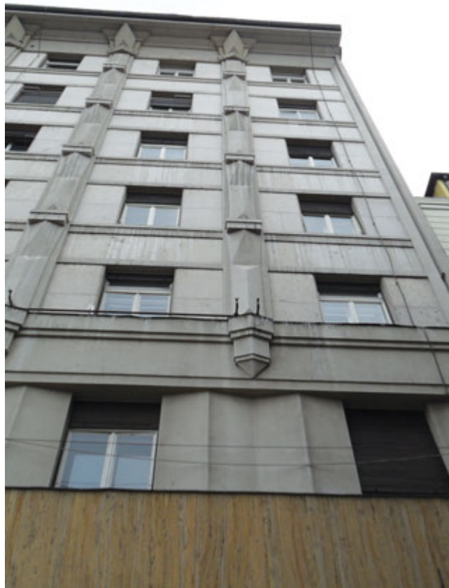
6. Детаљи pročеља „Реунионе“ у Чика Љубиној улици 6. Details from the front view of “Reuniona” in Čika-Ljubina Street

Уколико потпунија истраживања сарадње браће Карнелути са ограницима тршћанске осигуравајуће компаније не потврде изнете претпоставке о њиховом коауторству, пажњу би требало преусмерити ка осталим италијанским пројектантима који су у међуратном раздобљу градили европска представништва ове компаније. Ипак, док се вишедеценијска контроверза о