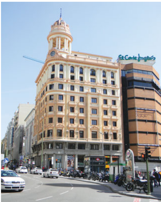
3. Палата Осигуравајућег концерна „Алијанц“, Мадрид 3. Palace of the Insurance Association “Alliance”