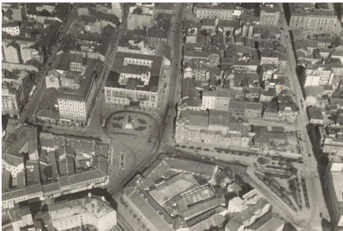
2. Позоришни трг тридесетих година XX века, изглед из ваздуха 2. The Theatre Square, from the 1930's, aerial view