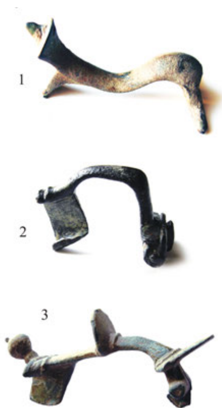
7. Табла 6