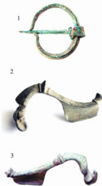
3. Табла 2

Гледајући шири историјско-географски контекст римске власти на тлу Србије, крушевачко подручје се у доба када је римска држава била стабилна налазило у провинцији Горњој Мезији, надамак и између рудничких