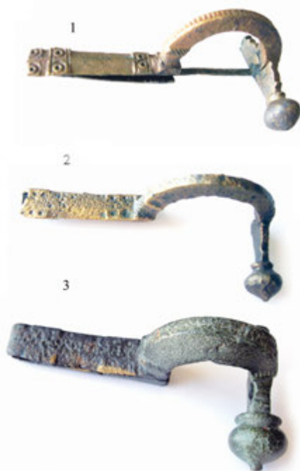
4. Табла 3

Током археолошких ископавања локалитета „Конопљара“ у селу Читлук, четири километра северо-западно од Крушевца, пронађено је пет римских фибула (Рашковић 2001: 81–89). Датовање тих фибула указује на континуитет живота у овом насељу од најмање три века. Изразито профилисана фибула датује се у први или други