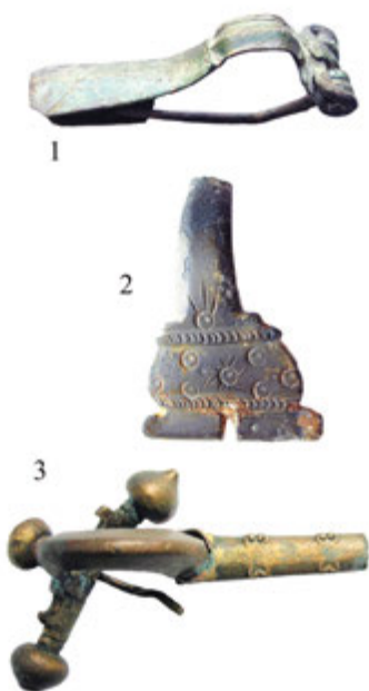
2. Табла 1

Са овог подручја, од Копаоника на западу до Велике Мораве на истоку, потичу бројни налази античке материјалне културе, који се чувају у археолошкој збирци Народног музеја у Крушевцу. Међу предметима које можемо повезати са временом римског присуства у Поморављу истичу се управо налази фибула. За израду фибула најчешће се користила бронза. Поред бронзаних фибула, збирка Народног музеја у Крушевцу поседује фибуле израђене од гвожђа, а на неколико примерака сачували су се трагови позлате. Фибуле су у музеј доспеле археолошким ископавањима, откупом и поклонима. Значајна је збирка фибула која потиче са терена римског пагуса у селу Почевина код Трстеника, а коју су поклонили налазачи.