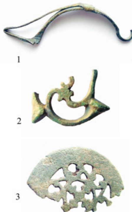
6. Табла 5

У ближој околини Крушевца, у зони простора Крушевачке котлине, постоји неколико археолошких налазишта античких насеља, римских викуса, са којих потичу појединачни налази фибула. Углавном је реч о налазима једне или две фибуле на локалитетима селâ из