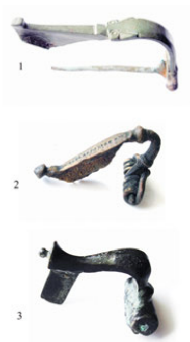
5. Табла 4

Конфигурација терена имала је одлучујућу улогу у настанку насеља у окружју стратешког места „Саставака“, код „Куле Тодора од Сталаћа“, или на „Укоси“, или пак на „Бедему“. „Бедем“ је низинско утврђење које се користило током и рукавцима Западне Мораве за